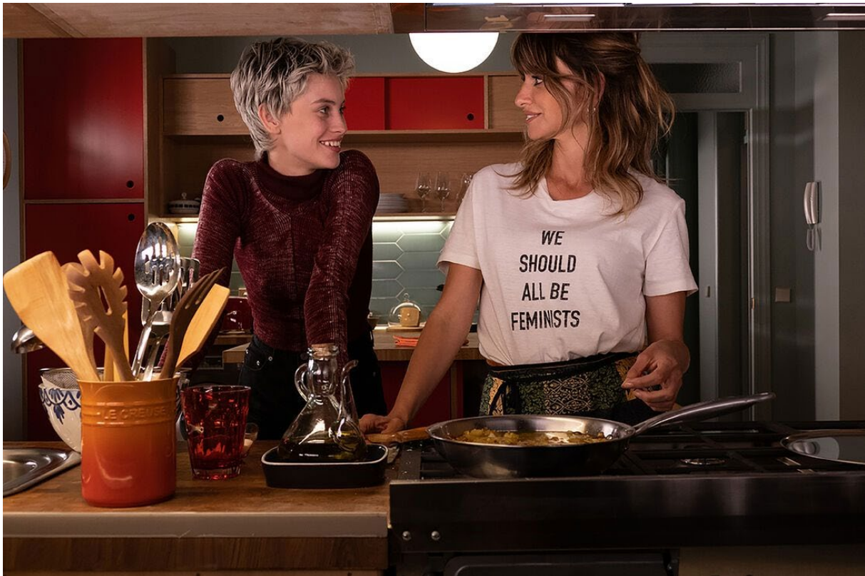
Publieksfavoriet no.7, 'Madres Paralelas'.

Gemeente Venlo, Europa Cinemas, Stichting Voedseltuinen Venlo, Theater De Garage, Bibliotheek Venlo