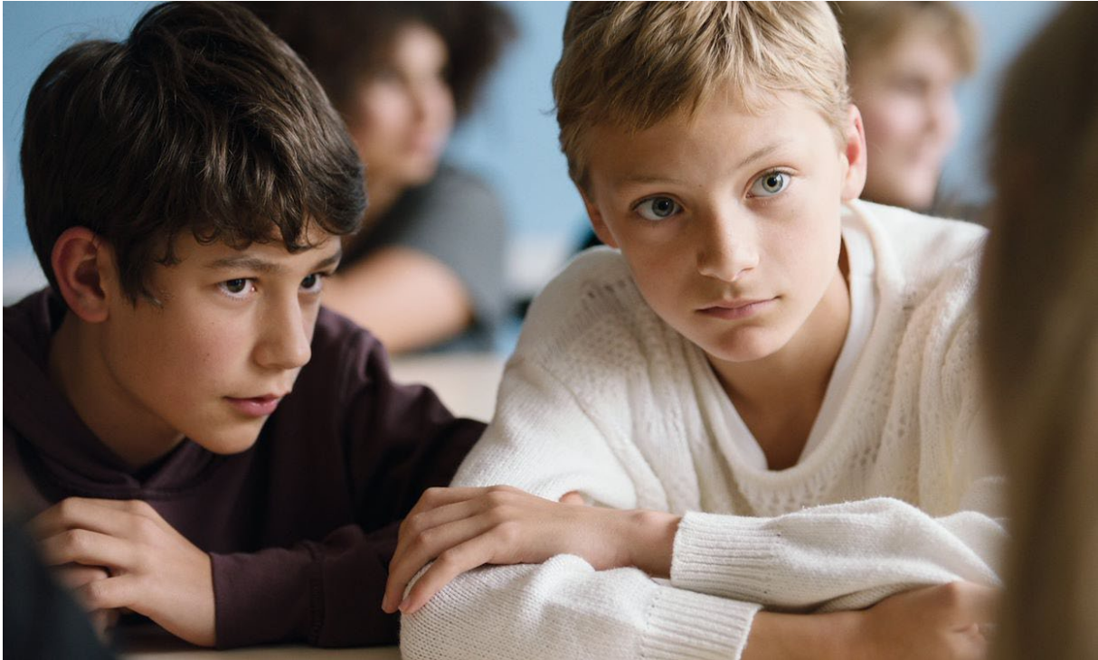
Publieksfavoriet no. 5, "Close"