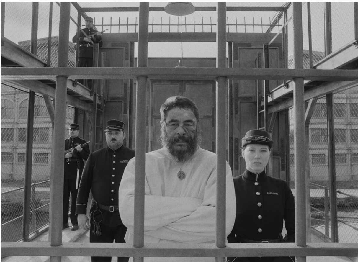
Publieksfavoriet no. 3, 'The French Dispatch' .