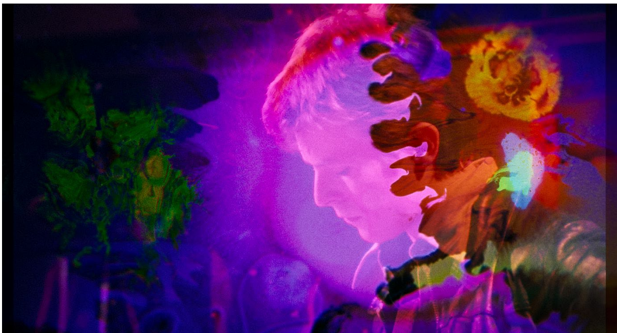
Publieksfavoriet no.1, 'Moonage daydream' .