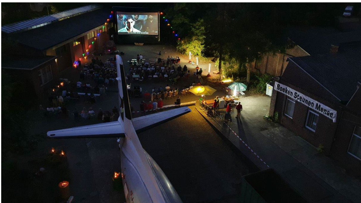
'Zien en Belevén', sfeerimpressie

Met in totaal 290 deelnemers en bezoekers een zeer geslaagd evenement.